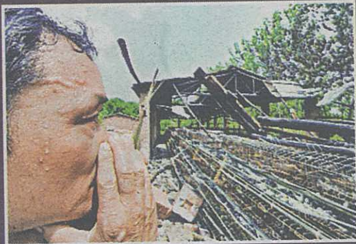
湖北省蘭溪鎮上月遭火球襲擊，整個養雞場化為灰燼。