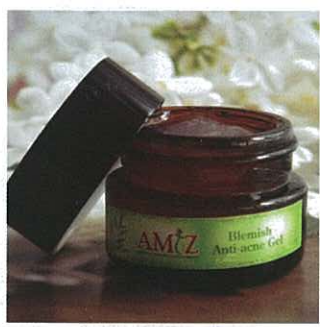
Amiz 水凝保濕抗菌暗瘡啫喱 $88(6份) 防止暗瘡形成，舒緩因暗瘡引起的紅腫， 消炎去印，減淡疤痕。