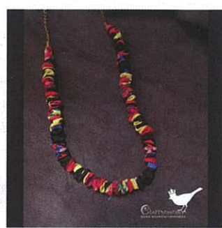
Cherryneene Handmade碎花串鍊(5份) www.flickr.com/cherryneene