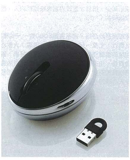
Elecom 「Spoon Mouse」 無線滑鼠$680 Black X Gray(2份)

為慶祝TalkTown Club的成立，我們為新TalkTown Club成員送上貼心大禮。凡於2010年04月21日或之前到 www.talktown.com.hk 登記成為會員或填妥以下表格傳真至2868 9809或連同表格郵寄至香港金鐘海富中心2期1704室，請於信封底註明「Talktown會員申請」，便有機會獲得以下禮品或優惠。先到先得，數量有限，送完即止。