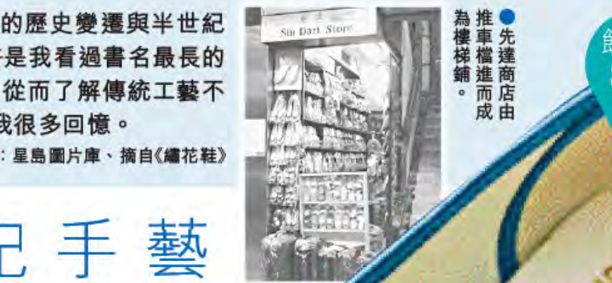
●先達商店由推車檔進而成為樓上舖。