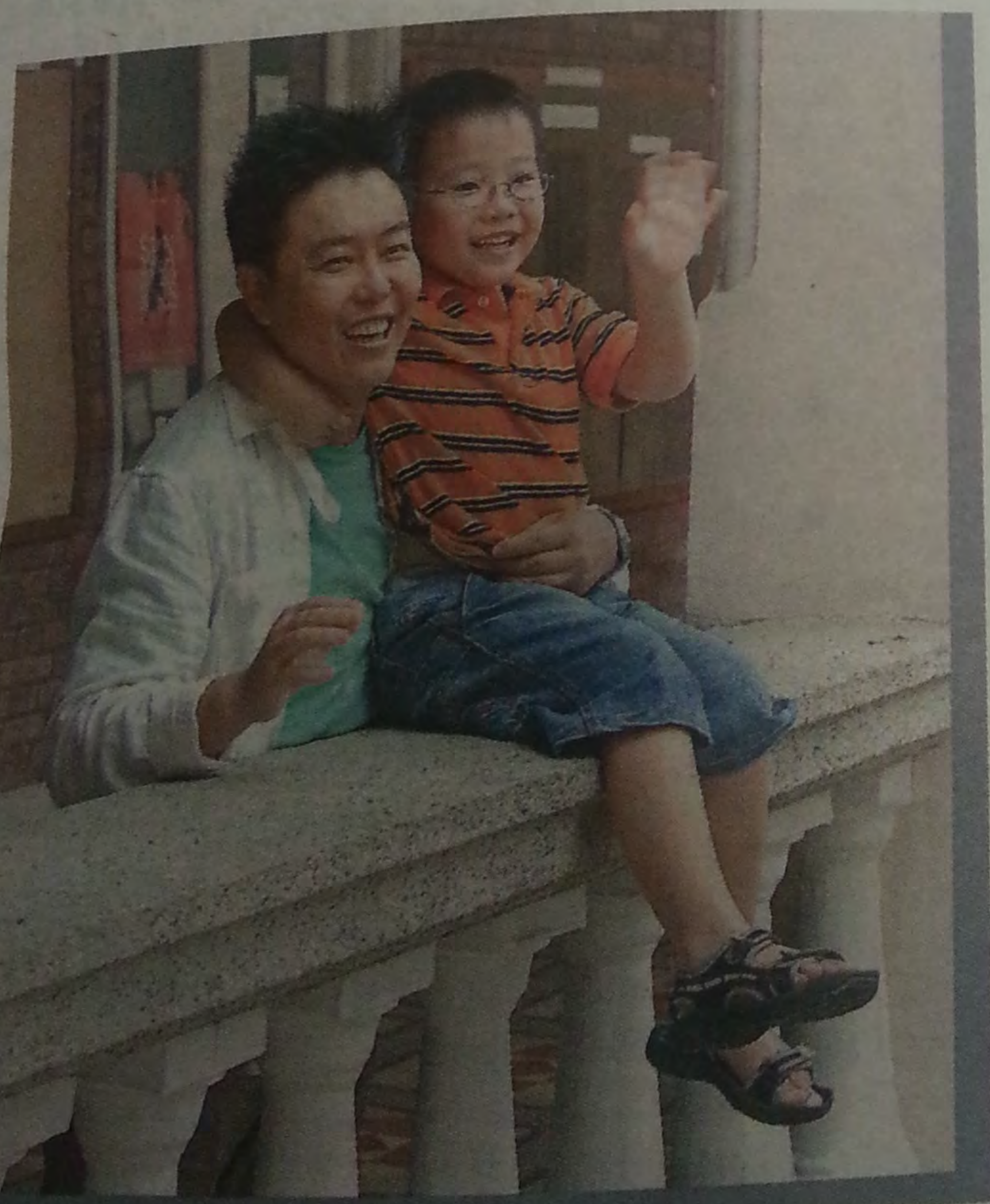
小濤影響，兒子也喜歡寫稿，更愛做小助手，幫忙校