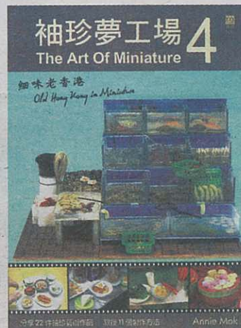
書名：《袖珍夢工場》 作者：Annie Mok 出版：青森文化