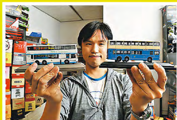
中學生應該沒有見過 Dennis 手上的中華巴士（專營權已於 1998 年結束），圖右的是傳統無冷氣的車款，圖左則是有冷氣車款。兩款巴士型號同為 Leyland Olympian。