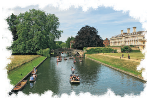
劍橋大學辦學歷史悠久，學術氣氛濃厚。（資料圖片）