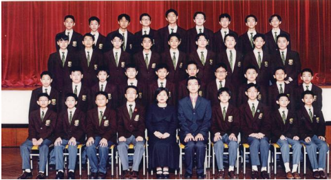
在聖貞德中學第二年的全班大合照 (右邊第三行第四位是本人)

安全，但難保校外這些人會做些什麼而對我產生威脅，所以在這種形勢分析及判斷下，我選擇了沉默應對，避免節外生枝。雖然孤獨，但卻讓我把精力投放在另一國度之上開啟另一片天。