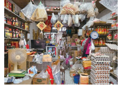
華東國貨公司雜貨舖

一種流淌在血液裡的、理所當然的責任。我沒有懶惰的藉口，因為我是哥哥，必須成為榜樣；我更不忍心看著父母從天亮忙到夜晚，他們被生活磨得粗糙的雙手和日益彎下的腰脊，無聲地催促著我，必須為他們多分擔一點。