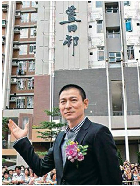
名人劉德華天王題字「藍田邨」，當時十五座正是雜貨舖的位置（相片出處：網絡，新會商會藍田小學資料館 SWCSS Museum Facebook 專頁）