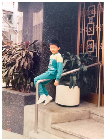
自从小就同恒生銀行結緣

最初，欺凌只是取笑和起綽號。每當我走過，就有人叫我「低B仔」、「白痴」、「阿呆」。後來，欺凌開始升級。我的書包經常被人打開，裡面的書本被扔得到處都是。每次回到座位，都要在課室四處翻找課本、筆盒。我的校褸本來是深藍色，放學時總是被同學用粉筆畫得花花綠綠，像極了畫布。每年平均要換十多個筆盒，因為不是被人扔爛，就是在「惡作劇」中消失。