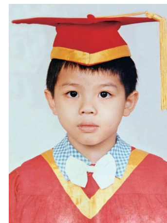
明我幼稚園畢業時拍的照片

至於我的童年，由於經常與病魔搏鬥，所以自小比較知足和簡單，沒有在生活上有太多要求，但唯獨學習方面在大多數情況下處於差強人意的狀態。直至長大從事與教育相關工作，發生過各種不可思議事件，亦曾經被不少校長問過是否資優生，再回望這段過去的童年和學習經歷，慢慢意識到當中的問題是如何導致往後的學習之路異常崎嶇和困難重重。接下來將會與各位讀者分享一段又一段真實故事和想法，帶著各位讀者走進我三十多年的人生中，了解這位充滿傳奇故事的八十後香港青年。