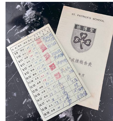
小學六年班成績不合格，冒爸爸簽名

在家裡，我是沉默寡言的一個，性格內向，既不是最聰明的，也不是最可愛的，更不是爸媽眼中的「寵兒」。所以我常常默默地在角落玩樂沉醉著自己的小世界，但我亦會跟著大隊出去玩，往往就像個背景角色般加添了其他人做主角的色彩，偶爾在散場的時候，我也是會被人遺留的一個。