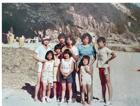
一世一次，除了爸爸要返工外，全家去龜背灣旅行

由於小學成績不算「閃亮登場」，我順理成章地進入了一所私立女子中學。中一至中三的三年時光，我基本上是「人去哪裡，我便去哪裡」，跟著同學上課、玩樂，像一條沒方向的魚在校園