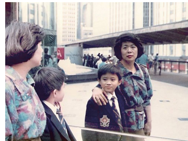
讀聖保羅小學的時間同媽媽合照

一開始還有幾個同學會主動靠近我，嘗試和我閒聊，但很快他們發現我話不多，又反應慢，就漸漸疏遠。漸漸的，我在班上的存在感越來越低。孩子的世界其實很殘酷，弱小和孤單的人最容易被忽視，甚至被欺壓。很快，我便成為班上被欺凌的對象。