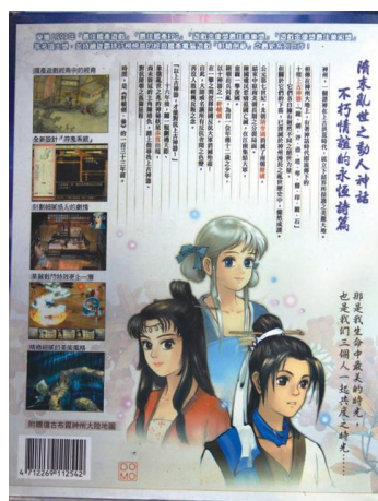
單機遊戲中最愛的「軒轅劍系列——天之痕」，曾帶來不少啟發及對中華文化有深入了解

與大家分享，說明它的實質意義和價值確實非凡，再看我目前三十多歲這個人生階段所獲得的事業發展成果、才能、殊榮等，有誰可以質疑我當年的所作所為，以及所思所想是有問題的？當你做一些超前的事情，或者擁有前沿想法，在未看到一連串成果之前，很多人都會對你的選擇和決定貼上質疑的標籤，甚至等待幸災樂禍的一天出現。