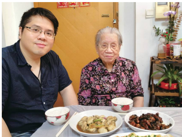
從小到大最疼我，把我記掛在心裡的外婆，縱使記憶力衰退仍深刻記得我的過去