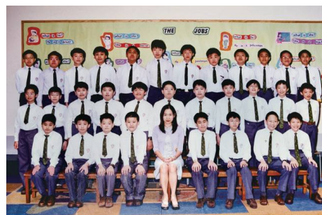
聖貞德小學四年級全體同學與姚老師合照 (第二行正中間是本人)

我的這段童年故事確實對我的大半人生有著至關重要的無形影響，也是很多小朋友的寫照，特別是以前我們的教育制度的確埋沒了不少擁有另類天賦的人才，但社會發展走精英主義的過程就是這樣殘酷。我希望在首個篇章中帶出此事多加留意，未來避免再次出現在自己的下一代身上，亦借助書籍讓看到故事的讀者們作為借鏡參考，引起大家對選校、補習及教育方式的反思。