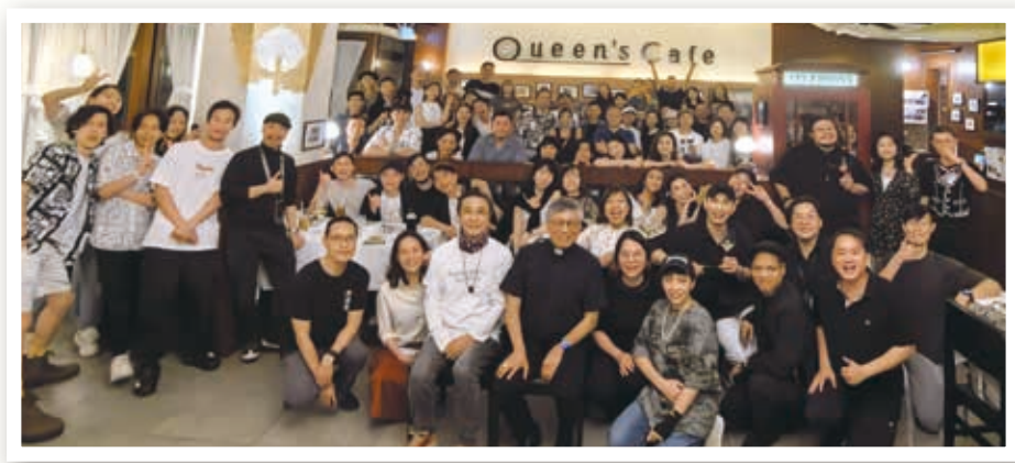
劉松仁先生（前排白衣）與周守仁樞機（前排黑衣）與《利瑪竇》音樂劇演職人員合影