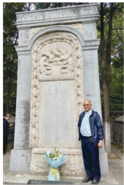
陳志明神父於利瑪竇墓