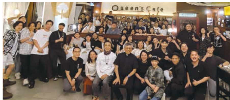
劉松仁先生（前排白衣）與周守仁樞機（前排黑衣）與《利瑪竇》音樂劇演職人員合影