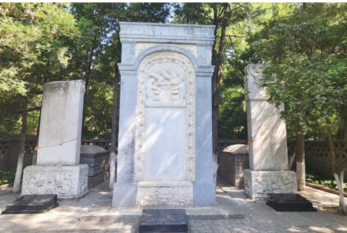
湯若望、利瑪竇、南懷仁之墓

瑪竇墓西側，比利時傳教士南懷仁則安葬於利瑪竇墓東側，另有部分中國教士亦長眠於此。滕公柵欄墓地由此成為明清以來天主教在華傳播的重要歷史縮影，為研究中西宗教文化交流提供了珍貴的史料線索。