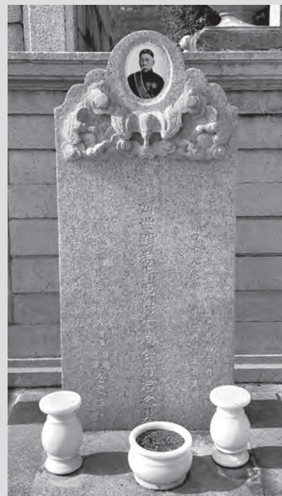
周壽臣位於香港仔華人永遠墳場墓地