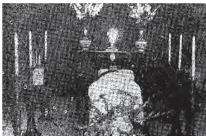
周壽臣遺容

麒麟師帶領祈禱，眾親友向靈柩及遺像行三鞠躬禮，最後由「九老會」（按：1932年由九名已達花甲之年的華人領袖周壽臣、李煜堂、李右泉、杜四端、馮平山、郭少流、郭靖堂、簡熾南及傅翼鵬組成的聯誼會）後人扶靈。香港總督柏立基伉儷及其他政府官員離場後，出殯儀式開始，靈車車頭放置周壽臣的遺像並以橫額書有「周府出殯」，離開松壽居；駛至香島道後，親友們才離去。當天下午壽臣山道實施單程行車達三小時半，交通警亦於壽臣山道當值，指揮車輛。另外，由於周壽臣為娛樂戲院董事長的緣故，因此娛樂戲院於其舉殯期間停映2時半一場電影。周壽臣的靈柩最終安葬於香港仔華人永遠墳場家族墓地。由以上可見，雖然周壽臣的舉殯事宜不算隆重，卻仍是星光熠熠。值得一提，周壽臣早於1922年已將其父母周錦書與吳太夫人的骨殖遷葬於香港仔華人永遠墳場，並邀得民國前國務總理梁士詒（梁燕孫）於家族墓地內題聯「閱盡滄桑歸泡影，永留喬蔭護雲礽」，可見他生前早已計劃好家族墓地的事宜。