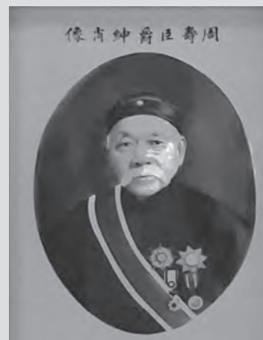
周壽臣玉照（位於保良局）