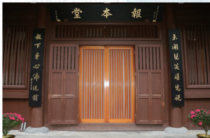
相片選自學海書樓：《香港名勝楹聯賞析集》