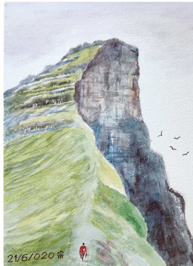
蘇宗慶 / 繪

與此相反的例子也是有的，買下房子之後，幸運的人就在不知不覺中得到了好處，事事都順利起來。