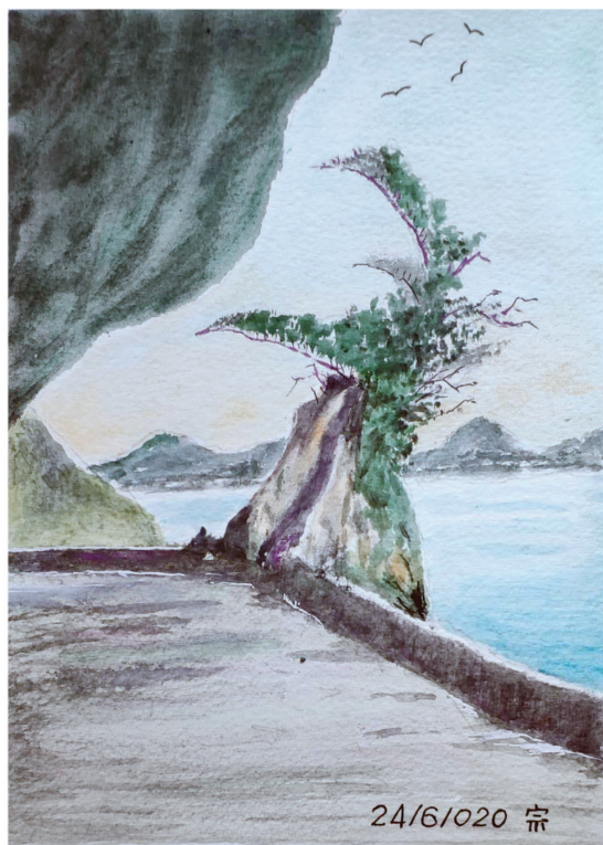
蘇宗慶 / 繪

用，調整好氣場則可以有「後天能量」補充。關鍵在調整好氣場和打起十二分精神保持好氣場。往往一不留神，把一件凶物帶回家，就自己把氣場破掉了，帶來惡運。