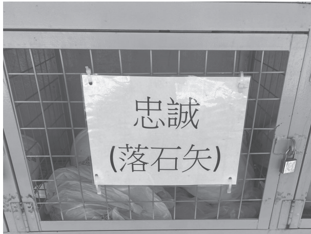
攝於 2021 年 5 月，建築工地，香港旺角。

從前香港有一職業名「倒夜香」，負責倒馬桶，因忌該物「臭」，故此，用其反義字「香」婉言之。 148 另外，比較具「香港特色」的委婉語有以「交水費」或「放水」，暗指小便， 149 又以「殊殊」代表「小孩子小便」，部分家長慣在小孩小便時發出「殊殊」之聲，因而得名。同理，部分家長慣在小孩大便時發出「唔唔」之聲，故「唔唔」是「小孩子大便」的代替語。