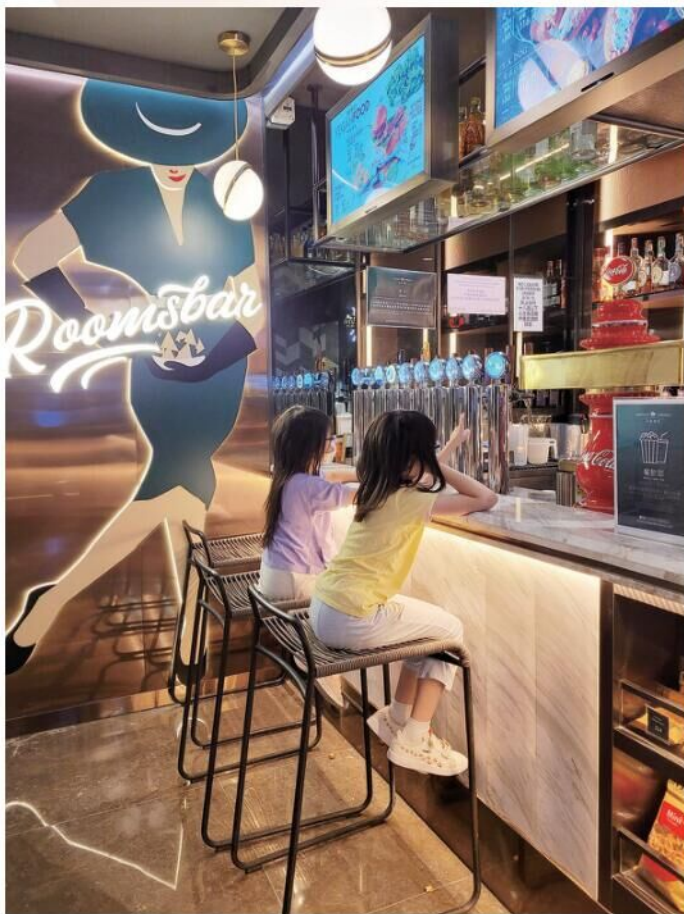
# 圖文不符 # 人生總是充滿疑問