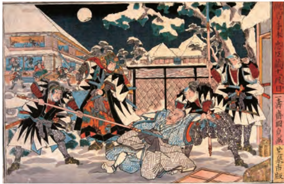
赤穂義士為主君復仇一幕，乃日本家傳戶曉典故，並經常被改編成人形淨琉璃、歌舞伎、電視劇集及電影等。 (圖片來自歌川國貞二代目「假名手本忠臣藏」十一段目)

芹澤鴨參照了一七零一年元祿赤穂義士仇討事件的赤穂浪士，當時赤穂藩藩主遭吉良義央誣害，赤穂藩家老大石內藏助集結了四十六名浪人殺入吉良府邸，斬殺殺主仇人。當時他們正是身穿袖口繡上山形紋的黑色羽織，這便是其後新選組隊服的雛形。雖然這起仇討事件最終以四十七人被下達切腹命令而落幕，但大石內藏助完全體現了對藩主的忠誠及堅強的信念，讓後世讚頌，也體現了武士為了維護名聲，不顧自身性命，而尋求被捨棄的公義。此故事於二零一三年被荷里活電影改編成《浪魂 47》。據說芹澤鴨對引用了