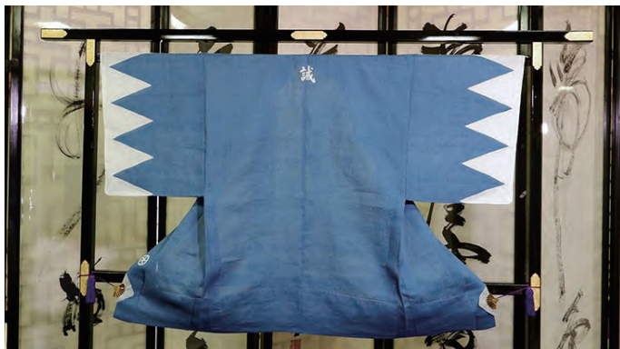
復刻的新選組羽織。大丸京都店根據江戶時代歷史記載的天然染料技術及手織麻布物料，把當時新選組淺藍色羽織重現，並在二零二零年四月於壬生寺展出。