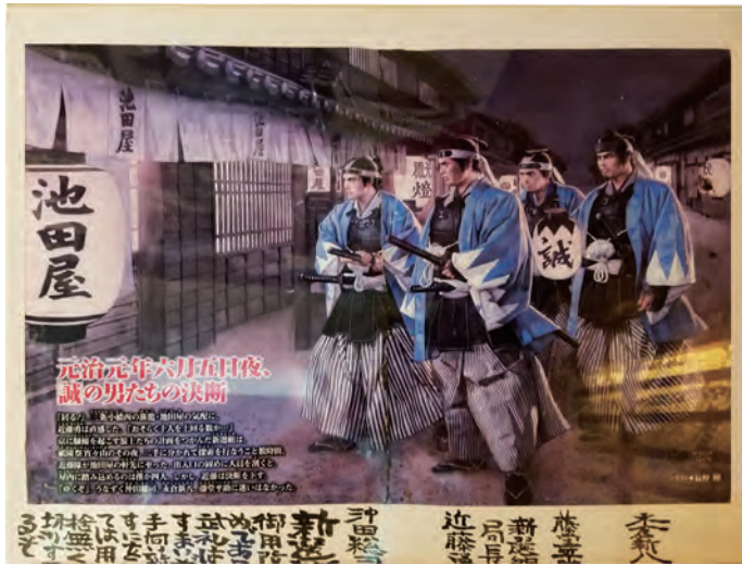
插畫師長野剛描繪對新選組隊服歷史的印象