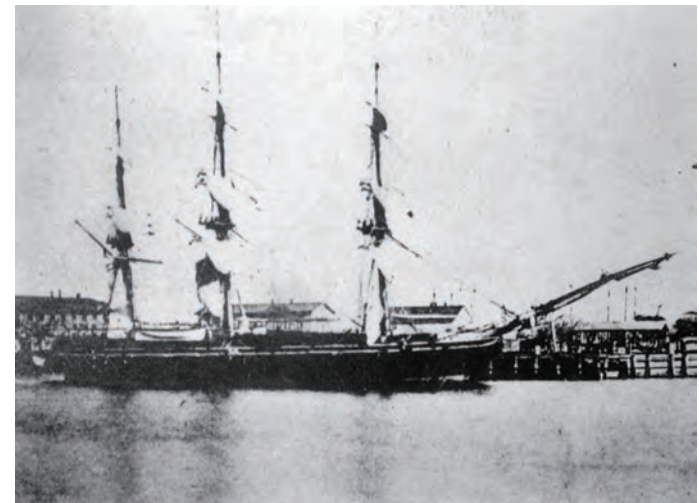
薩拉托加號，為其中一輛到訪黑船。

一六零三年德川家康於江戶（現東京）設立幕府，稱為「江戶時代」。雖然一六三五年起實施「鎖國令」，除允許與中國及荷蘭交流外，一律斷絕其他外來經貿，但江戶時代仍然是日本史上最強盛時期之一。直至一八五三年六月三日，美國派出由培里（Matthew Calbraith Perry）率領的四艘巨艦，而船身塗上防止生鏽的黑色柏油，停泊在江戶浦賀港，用科技威攝並迫使幕府開國，史稱黑船來航。翌年一月十六日，培里再度率領九艘軍艦來到江戶灣，此舉讓日本感受到外來技術發展的衝擊。