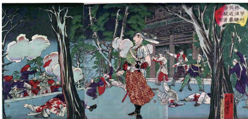
錦繪圖「甲州勝沼之戰近藤勇」。由近藤勇率領的甲陽鎮撫隊與新政府軍於甲斐國勝沼（現山梨縣甲州市）對峙，因攻打不下及內部矛盾而全軍撤退至八王子並解散。

甲陽鎮撫隊身穿白色棉衣的洋裝，扛著步槍，猶如一支西洋軍隊。路經近藤勇家鄉石原村及土方歲三家鄉日野宿，總算衣錦還鄉，沿途盡受百姓熱烈歡迎，百姓對他們能從農家孩子一躍成為幕府大