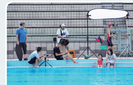
製作的微電影及資訊短片 多條微電影現於醫院及網上平台播放