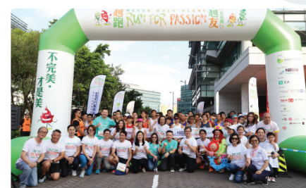
「越跑·越友」慈善賽 籌辦各類大型活動，凝聚癌症同路人，同時喚起公眾人士對癌症之關注