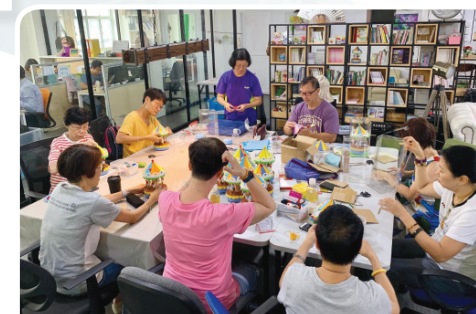
工作坊 透過不同藝術及健康工作坊，提供身心支援，讓大家互相連繫