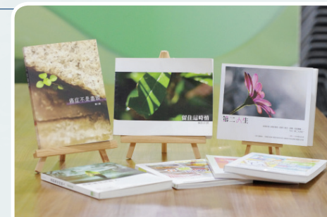
刊物出版 出版病人分享集及癌症刊物，提供實用資訊