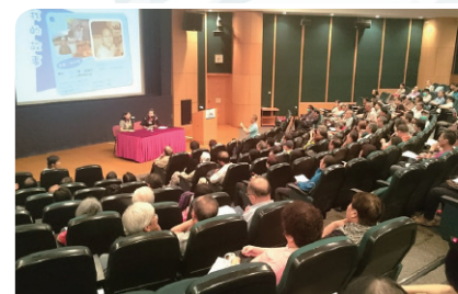
專題講座及展覽 透過抗癌經歷分享及醫生講解，讓大眾對各種癌症有更全面的認識