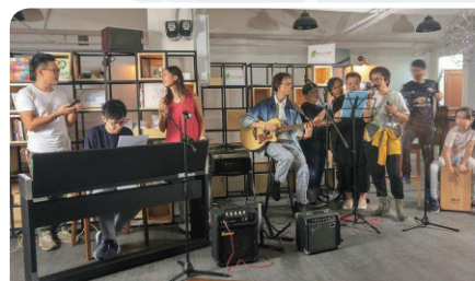
癌症資訊網樂隊 由癌症患者組成，以音樂發放正能量