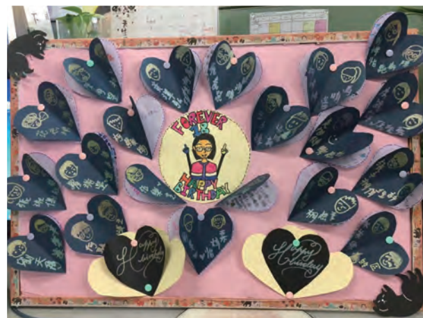
2018年生日6B所贈的巨型生日卡。