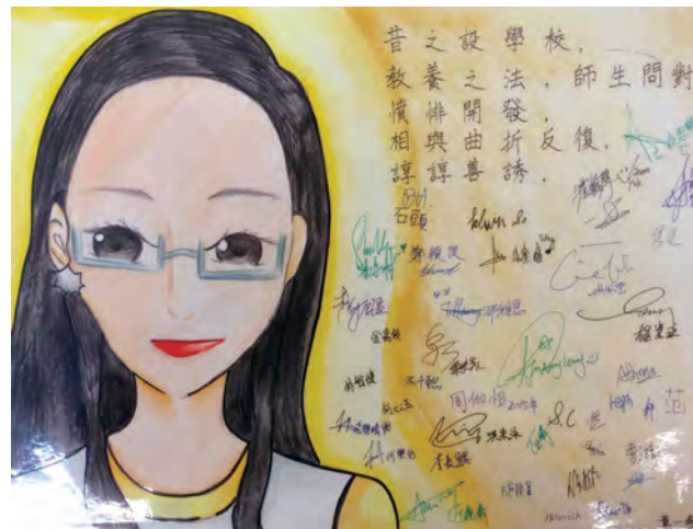
2015年散學禮3A所贈紀念卡