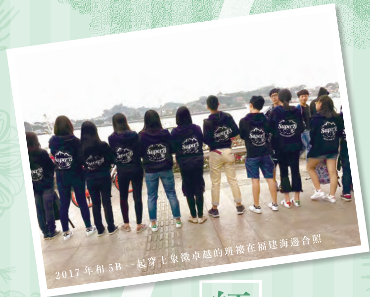
2017年和5B一起穿上象徵卓越的班褸在福建海邊合照