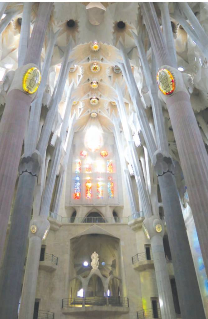
〈 Gaudí 的設計與大自然息息相關

“ There is no reason to regret that I cannot finish the Church. I will grow old but others will come after me. What must always be conserved is the spirit of the work but its life has to depend on the generations it is handed down to and with whom it lives and is incarnated.”