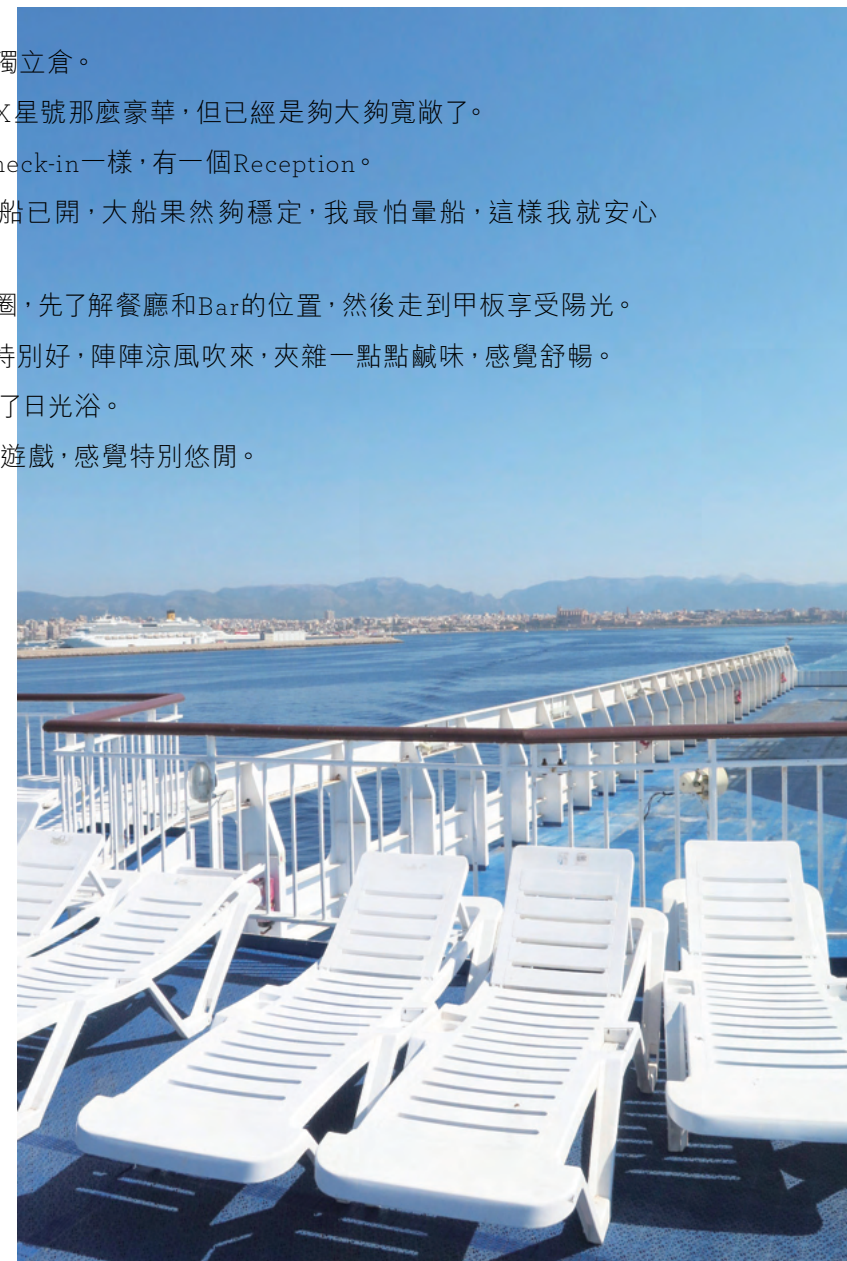
〉船上日光浴真的愜意得很