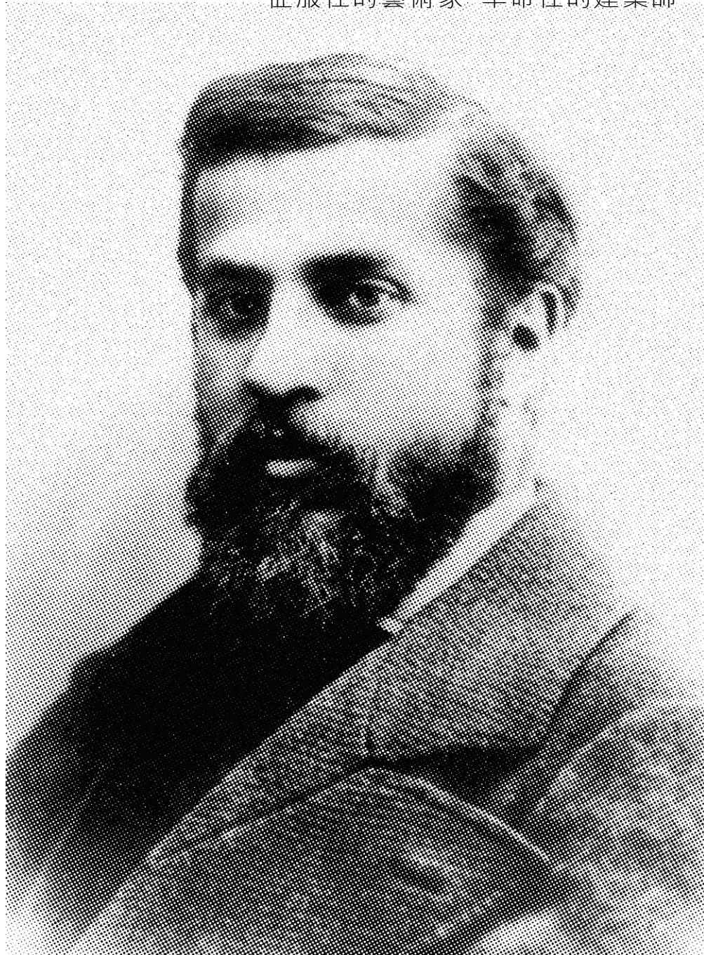
Antoni Gaudí (安東尼·高第) 1852-1926