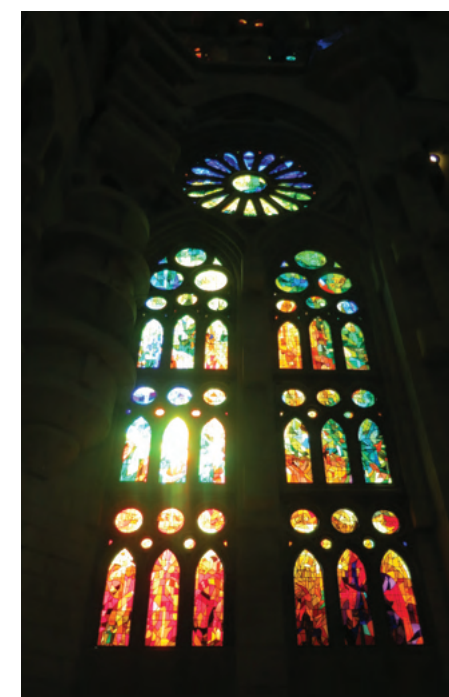
〉 光也在Gaudí的計劃之內