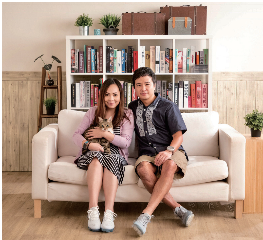
●Oki's family，攝於二零一八年九月《新假期》雜誌訪問

從國際通附近出發，沿着331公路南下，右邊盡是一望無際的大海，迎面吹着海風，偶爾灑着一點陽光，不知不覺便駕了大半個小時，亦到達琉球村——我們和O.S.初次邂逅相遇的地方。