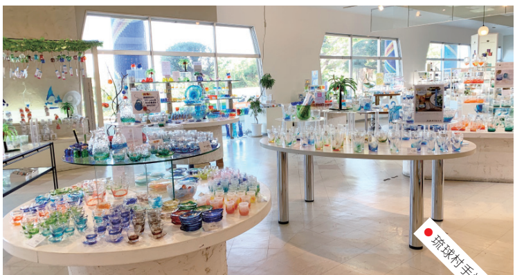
● 琉球村手造琉璃擺設

我們上了餐廳，點了拉麵和刨冰，正想跟職員說他們在外面飼養的貓咪很可愛。「貓咪？甚麼貓咪？」一臉疑惑的職員似乎真的聽不懂我們在說甚麼。「我們這裏沒有養貓呢？」一個製作琉璃藝術品的地方按常理應該會擔心貓咪跳來跳去，弄破商品，才真的不會養貓呢。那外面的小貓一定是流浪，而且一直喵喵大叫，定必是餓透了。