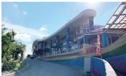
● 到達琉球村，陽光普照

琉球村是一個製作沖繩傳統琉璃藝術品的地方，裏面有着各式各樣沖繩手造的琉璃擺設，也有供遊客製作琉璃的體驗興趣班。當天到埗已經是正午十二時，我們泊好了車子，便馬上按計劃朝着餐廳出發，找位子，吃刨冰。