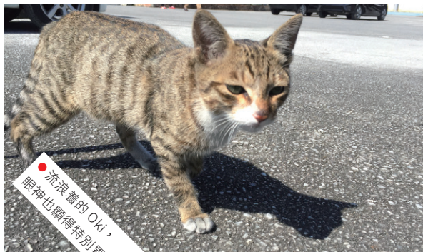
● 流浪着的 Oki， 眼神也顯得特別累。

第一眼看到小貓，已經覺得牠比其他貓咪瘦弱，再認真看看，發現小貓的手部皮膚沾污了一大片，好像是發炎受傷了。而小貓給我們的感覺卻是異常黏人，令我們當時沒有想過牠是在流浪着的。