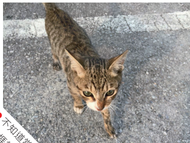
● 不知道當時的Okī 捱餓了多久