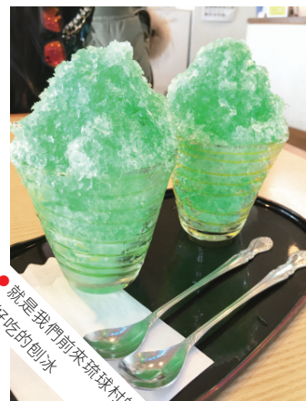
● 就是我們前來琉球村的目的。 超好吃的刨冰。