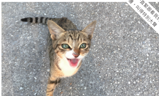
● 一直緊跟着我們腳邊，叫得特別大聲

我們上了餐廳，點了拉麵和刨冰，正想跟職員說他們在外面飼養的貓咪很可愛。「貓咪？甚麼貓咪？」一臉疑惑的職員似乎真的聽不懂我們在說甚麼。「我們這裏沒有養貓呢？」一個製作琉璃藝術品的地方按常理應該會擔心貓咪跳來跳去，弄破商品，才真的不會養貓呢。那外面的小貓一定是流浪，而且一直喵喵大叫，定必是餓透了。