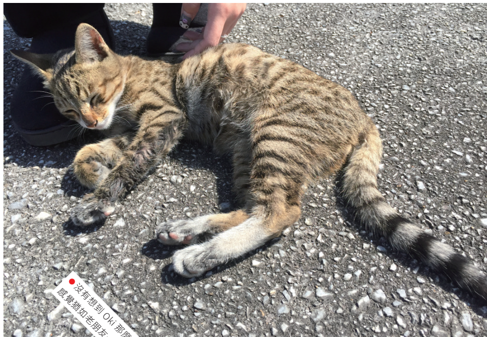
● 沒有想到 Oki 那麼黏人， 感覺猶如老朋友一樣。

此時就在琉球工場門外，聚集了幾個日本遊客，他們圍在一起，像是在討論甚麼似的。我們走過的時候，突然傳來「喵喵、喵喵」的叫聲，而且聲音愈來愈響亮，原來是一隻虎紋小貓，而他正迎面朝着我們跑過來。