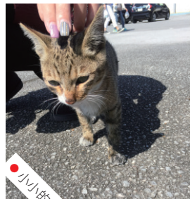
● 小小Okī 等待我們

我們快快吃過刨冰（刨冰仍是那麼好吃），便帶了幾條麵條，去找外面的小貓。此時正有幾個遊客在跟小貓玩耍，不過小貓一眼看到我們，便馬上飛奔過來。「快點吃吧！」話還未有說完，小貓已經吃光了Crystal手上的麵條，然後又開始磨蹭着我們。於是我們立即把車上能給貓咪吃的都拿了出來，乖乖奉獻給小貓了。先來一包鱈魚絲，雖然是人吃的零食，但暫時充飢總比餓着肚子好吧。「Okī，你是不是很餓呀？你是自己一個嗎？你的同伴呢？」由這一刻開始，流浪小貓亦有了屬於自己的名字。這名字是媽媽Crystal改的，也是很自然，由心而發想要把小貓叫做Okī的。