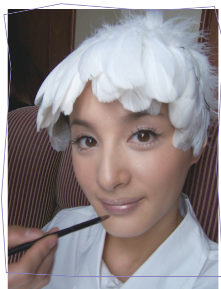
● 拍攝雜誌初期的自拍

無從考證真偽，可自己出於善意的幫助行為卻莫名地陷入了搬弄是非的漩渦中，實在是有些鬱悶和多餘。靜下心來想，未必瞭解事實真相的圓確實不應該插足他人公司的政治鬥爭，那時候的圓還是天真了。電話事件發生後，圓也沒有再和這間公司合作過，這職場的小小挫敗也算是給圓上了一課。在那之後，圓的一位大學同學成為了圓事業上的貴人，給圓介紹了一個難得的工作機會。