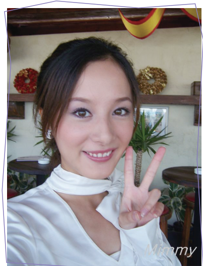
●第一次拍攝雜誌時的自拍

來說都是新鮮和興奮的，很幸運有三個女生一起工作，有人陪伴下，讓她不用那麼有壓力，也多了份勇氣、少了份第一次工作時的怯場。拍攝時，現場環境的佈置充滿愜意，三個女生曬著明媚的陽光，假扮喝著下午茶，三人中有一個女生個子特別高，她和圓還有另一個女生聊天，雖然彼此都是第一次見面，但因為拍攝場景是如此愜意，大家都沒有覺得尷尬和陌生。