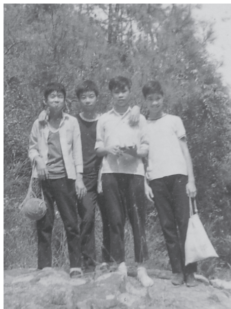
咕喱仔就讀中學時與同學合照