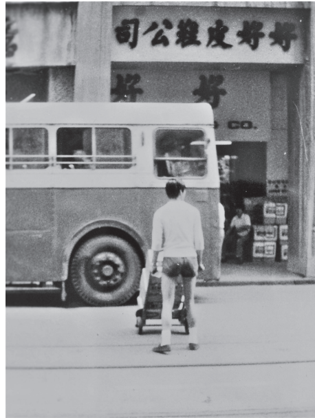
咕喱仔每天都在馬路左穿右插