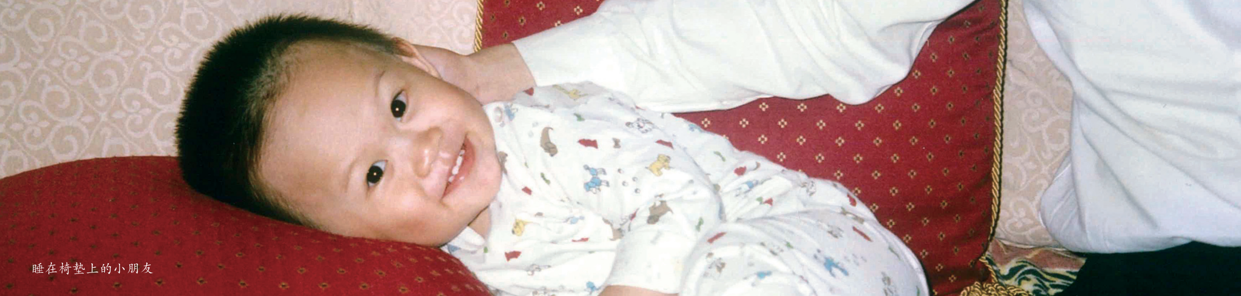
睡在椅墊上的小朋友