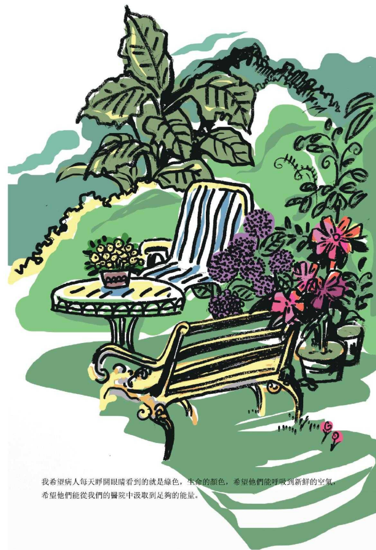
我希望病人每天睜開眼睛看到的就是綠色，生命的顏色，希望他們能呼吸到新鮮的空氣，希望他們能從我們的醫院中汲取到足夠的能量。

後來到西院區的進一步完善，我們醫院有自己的田地種復能有機食材，院區內樹木一片蔥郁，郊區空氣清新十分安靜，我們有大規模的復能公園，有供病人們做早操和跳舞的運動場，也有