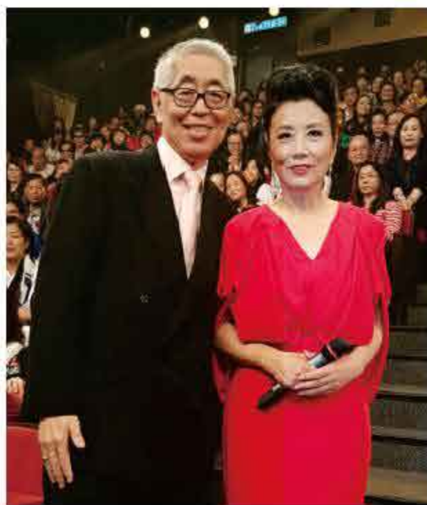
汪明荃現今仍是TVB的台柱，鎮台之寶。