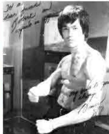
李小龍送給蔡和平的簽名相和明信片。