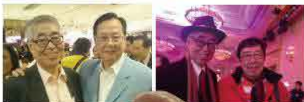
每年都有不同演員出席。