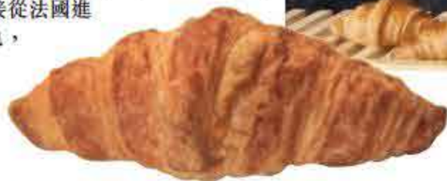
招牌牛角包乃100%法國材料製成，香味誘人。