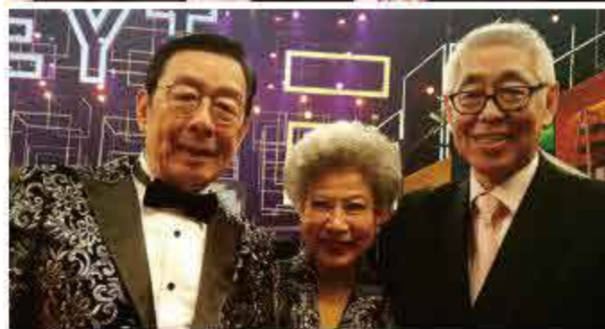
彼此相識五十載，友情不變。二位前輩今日仍活力十足。