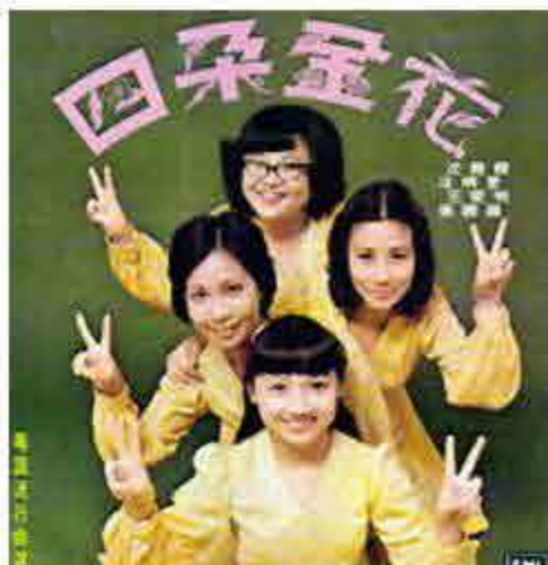
當年四朵金花唱至街知巷聞。