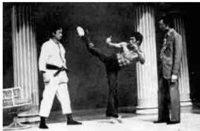
於電視上展示身手，教人數為觀止。