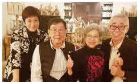
胡楓與蔡和平堪稱一對活寶貝，年紀大了依然活力十足。

多次以高齡踏足紅館舉行個人演唱會，最近一次是在2018年2月，打破紅館最大年紀歌手開演唱會的紀錄，並獲多位EYT好友及契仔契女明星支持。修哥憑着精湛的演技、敬業的態度及風趣的性格，一直深得圈內人尊重及觀眾愛戴。2003年便獲得《第八屆香港金紫荊電影獎》的「終身成就獎」。