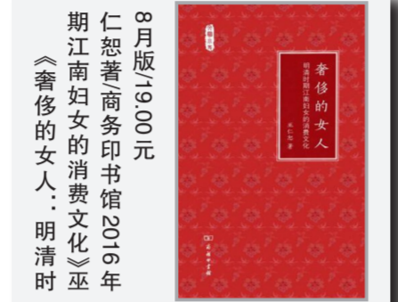
8月版19.00元 仁恕著 商务印书馆2016年 期江南妇女的消费文化《巫 《奢侈的女人:明清时

我国台湾大学历史学博士,“中研院”近代史研究所副所长、研究员。主要研究领域为明清社会经济史、明清文化史、中国城市史。