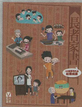
書名:《長者家書》 編者:長者家慈善基金 出版:青森文化